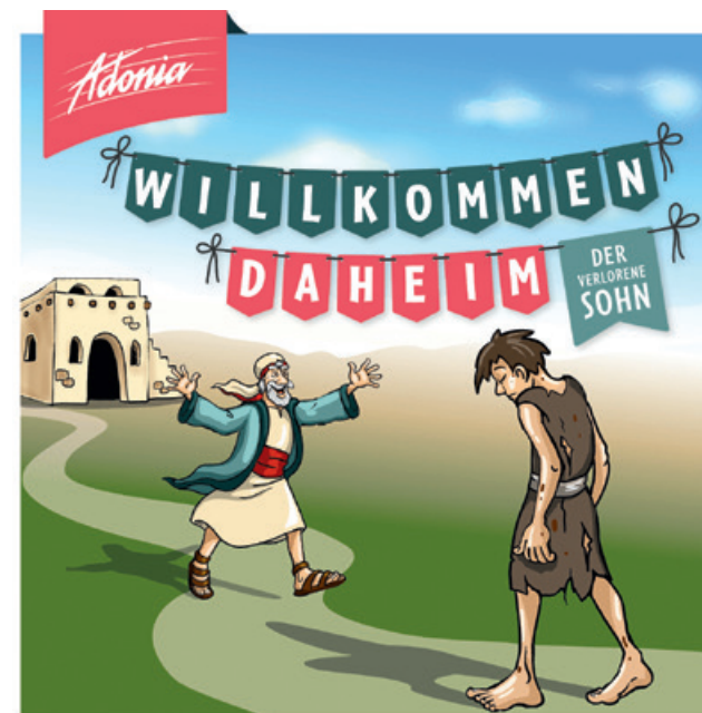
ILLUSTRATION: SIMON LEIMBECK

Am Freitag, dem 24. Juli um 19 Uhr wird im Volkshaus Wildau ein besonderes Konzert stattfinden: Ein Adonia-Junior-Chor wird zu Gast sein und ein Musical auf die Bühne bringen, das von Kindern selbst gestaltet wird. Rund 70 Kinder werden an diesem Abend gemeinsam auf der Bühne stehen – aus Berlin und Brandenburg. Sie werden das Musical im Rahmen eines sogenannten „Musicalcamps“ einstudieren. Innerhalb von nur fünf Tagen werden sie Texte lernen, Lieder proben und Szenen entwickeln. Gezeigt wird die Geschichte vom verlorenen Sohn, ein Gleichnis von Jesus, das viele kennen: Ein junger Mann geht eigene Wege, gerät dabei in Schwierigkeiten und kehrt schließlich nach Hause zurück. Wie seine Familie reagiert, erzählt das Musical mit Musik, Spielszenen und persönlichen Momenten. Wir freuen uns, dass auch Kinder aus unserer Region mit auf der Bühne stehen werden. Veranstalter des Abends ist die Friedenskirchgemeinde Wildau, die das Volkshaus für dieses Konzert kostenlos nutzen kann, ein herzliches Dankeschön an die Stadtverwaltung Wildau dafür. Gleichzeitig wird das Konzert erst durch die finanzielle