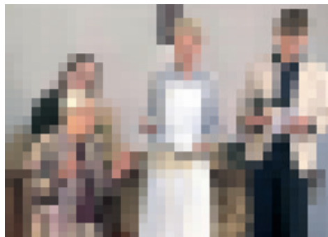
Das Kinderkirchen-Team zeigt in einem Anspiel die Geschichte der wiedergefundene Oblatendose.