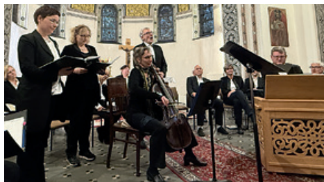
Die Solisten des Kantatenchores