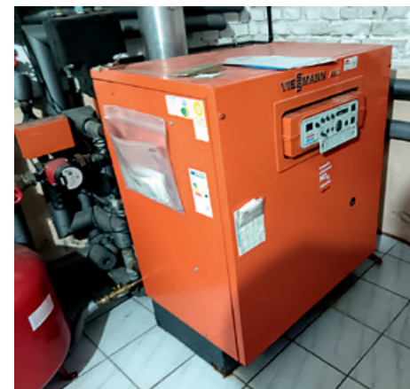
Abschied von der alten Heizung